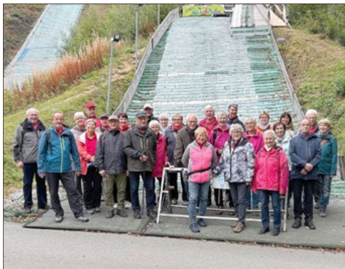
Vor der Brockenwegschanze