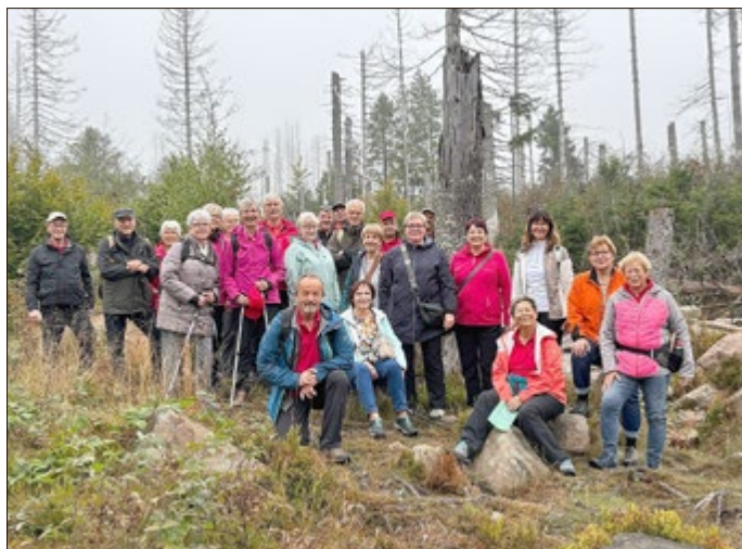
Im Nationalpark Harz