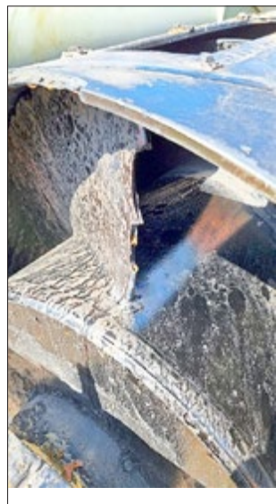
Abb: Korrodierte Schaufelblätter der alten Schnecken-pumpen

So wurden aktuell die Rücklaufschlamm-schnecken (RLS) auf der KA Bernterode erneuert. Bedingt durch die Abnutzung der RLS konnte der Rücklaufschlamm nicht mehr optimal transportiert werden, was unmittelbar Einfluss auf die Betriebs- und Entsorgungssicherheit hatte. Daneben stieg der Energieverbrauch exponentiell an, wodurch der Stromverbrauch der RLS oberhalb des energetischen Zielwertes lag. Somit bestand die absolute Notwendigkeit, sich der Sanierung oder Erneuerung der RLS zu widmen.