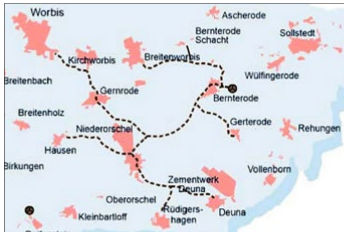
Abb.: Anschlusschema der KA Bernterode

Durch den frühzeitigen Aufbau der abwassertechnischen Infrastruktur konnte die Wasserqualität der Wipper seit Mitte der 1990er Jahre deutlich verbessert werden.