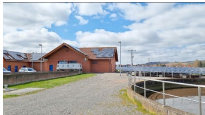
Abb.: PV-Anlage KA Bernterode mit Dach- und Freiflächen-Anlage

ge auf der KA Bernterode wird eine ca. 40 %-ige Energieautarkie erreicht. Im Zuge unseres Klimaschutzprojektes INEWA planen wir in 2022 in einem 2. Bauabschnitt die PV-Anlage zu vergrößern. Hierzu wird auch die vorhandene Schlamm-lagerhalle ertüchtigt, um auch weiteren Platz für Solarmodule auf dem Dach zu schaffen.