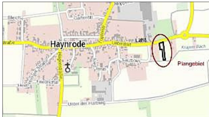
Lage des Plangebietes im Raum

Stellungnahmen können von jedermann während der Auslegungsfrist schriftlich oder während der Öffnungszeiten bzw. nach gesonderter Terminabsprache mündlich oder zur Niederschrift vorgebracht werden.