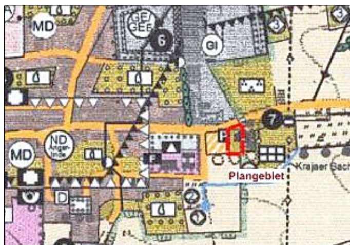
Lage des Plangebietes der 4. Änderung des FNP

Wesentliches Ziel der Planung ist die städtebauliche Entwicklung des künftigen Standortes für den „Eichsfelder Hofladen“ mit Fleischerei, Käserei, Gaststätte und Hofladen