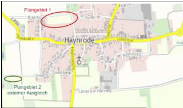
Lage der Plangebiete des B-Planes Nr. 7

hier: Bekanntmachung der erneuten öffentlichen Auslegung gemäß § 4a (3) BauGB