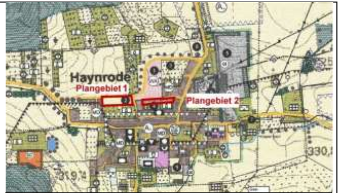
Lage der Plangebiete der 3. Änderung des FNP

Der Gemeinderat der Gemeinde Haynrode hat in seiner Sitzung am 07.07.2020 die gesetzlich erforderlichen Planverfahren zur Aufstellung des Bebauungsplanes Nr. 7 „Am Knick“ sowie der 3. Änderung des Flächennutzungsplanes der Gemeinde Haynrode eingeleitet. Die Grenzen der räumlichen Geltungsbereiche sind aus den mitveröffentlichten Übersichtsplänen ersichtlich. Die Verfahrensschritte der frühzeitigen sowie der formellen Öffentlichkeits- und Behördenbeteiligungen wurden durchgeführt. Im Ergebnis der Auswertung der Stellungnahmen wurden die Planunterlagen erneut überarbeitet.